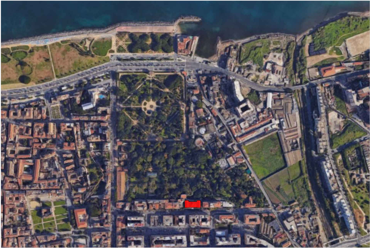
Aerofotogrammetria dell'area di intervento