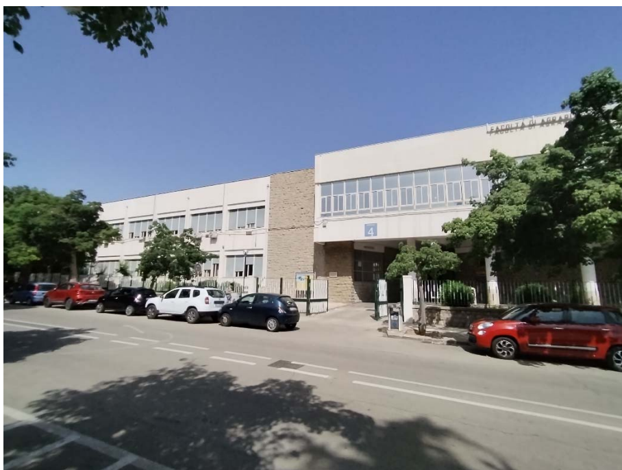
Foto 1 - Edificio 4

AREA EDILIZIA, SERVIZIO TECNICO E SOSTENIBILITA' SETTORE LAVORI E SERVIZI DI MANUTENZIONE ORDINARIA E STRAORDINARIA DEGLI EDIFICI